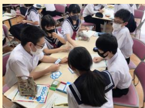
令和3年7月7日 福野中学校