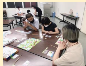
令和3年7月20日 Fortune * Field

富山県立大学の学生団体と南砺市が共同制作。サイコロを振ってコマを進め、マスに書いてあるSDGsに関連する内容に従って「人材」と「お金」のチップを獲得します。集めたチップを使って南砺に関連するプロジェクトを実行するなど、楽しみながら地域の取り組みやSDGs17のゴールについて知ることができます。