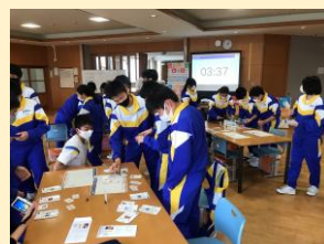
令和3年10月26日 吉江中学校