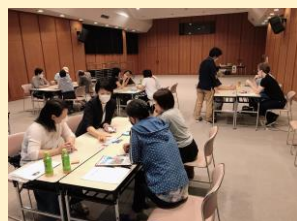
令和3年7月17日 南砺市友好交流協会