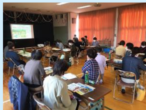
令和3年11月3日 なんと婦メイト