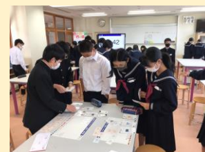
令和3年11月8日 福野中学校