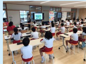
令和3年6月25日 福光中部小学校