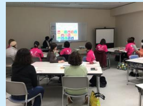
令和3年12月7日 南砺市商工会女性部